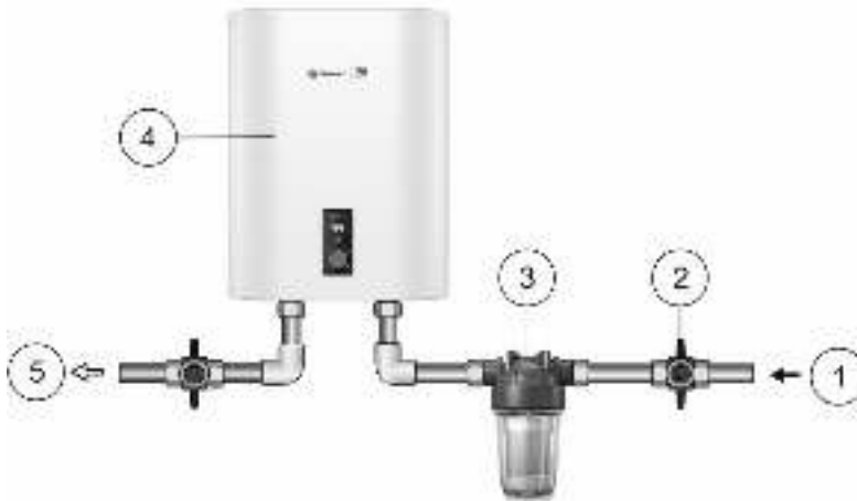
Рис.2 Схема подключения фильтра.

Внимание! Если водопровод не будет использоваться более двух суток, необходимо перекрыть общий кран подачи холодной воды на дом/квартиру.